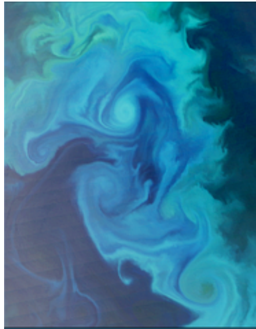
Figure 2 : Exemple typique de la distribution de chlorophylle (pigment du phytoplancton) associée à la turbulence océanique de méso-échelle.

tournant sur 27 nœuds – 216 processeurs - du Earth Simulator.